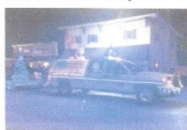
Bei der Welchnachtsparade in Westphalia fahren geschmückte Trucks durch die Straßen.

May cold and wet, will bring in a great harvest.