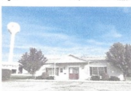
Der Ort Westphalia ist zwar vergleichsweise klein, ein Dorfbüro gibt es aber trotzdem.